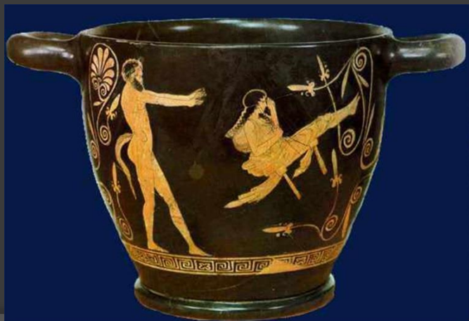
η Λιόρα είναι ένα πανάρχαιο Ελληνικό παιχνίδι, με βαθιές ρίζες στο συμβολισμό και τη μυθολογία, η τελετουργία του οποίου συνδέεται με τη λατρεία του Διονύσου και τη μαγεία. Και ακόμη, ότι η αιώρηση, το κούνημα, έχει αποτροπαικό χαρακτήρα.