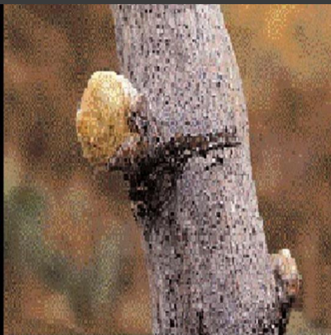
Ο βλαστός την ώρα που προβάλλει από τον οφθαλμό πάνω στο γόνατο της κληματίδας, λες μια χνουδάτη μπάλα, ένα λιλιπούτειο κεφάλι.