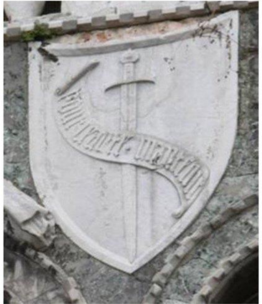
Arms of the King of Cyprus on Cornaro Piscopia Palace, Venice